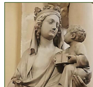
N. Sra. de Todo Poder Maison Mère - Valence

João Paulo II - O Rosario da Virgem Maria - 16