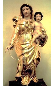
Vierge de Pierre Vigne

O Maria, aurora del mondo nuovo, Madre dei viventi, affidiamo a Te la causa della vita: guarda, o Madre, al numero sconfinato di bimbi cui viene impedito di nascere, di poveri cui è reso difficile vivere, di uomini e donne vittime di disumana violenza, di anziani e malati uccisi dall'indifferenza o da una presunta pietà.