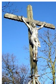
Croce a Montvendre

Con questo foglio, Padre Vigne ci lascia anche dei testi da leggere e rileggere per accompagnare il nostro cammino di Quaresima e Pasqua !