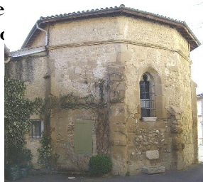
Ancienne chiesa Montvendre