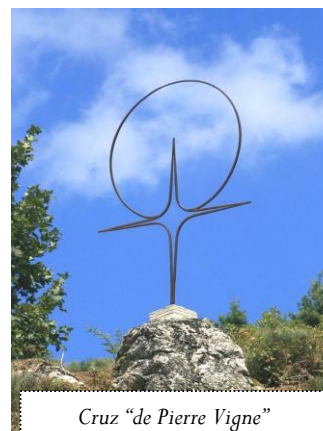
Cruz “de Pierre Vigne” em Rochepaule

Firmeza, alegria, engajamento, missão. Boa Quaresma rumo à Páscoa!